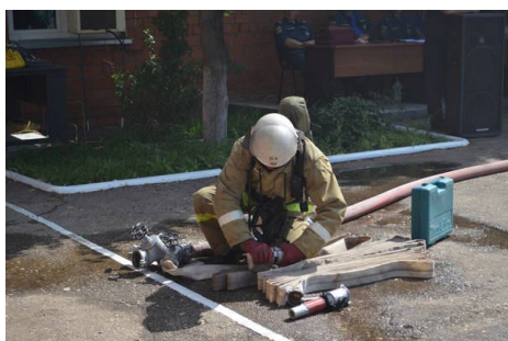
и судья останавливает секундомер.

Пьедестал, улыбки, награды... Церемония чествования победителей подводит день напряжённой борьбы к завершению. Подсчитывая баллы, судейская коллегия принимала во внимание штрафные очки не только за ошибки на дистанции, но и за неверные ответы по теоретическим заданиям. Как и в прошлом году, победу на соревнованиях завоевала команда ПЧ-15, вторая и третья позиции у звеньев ПЧ-9 и ПЧ-81 соответственно. Отрадно отметить, что все призёры – представители второго отряда ФПС ГПС по РТ.