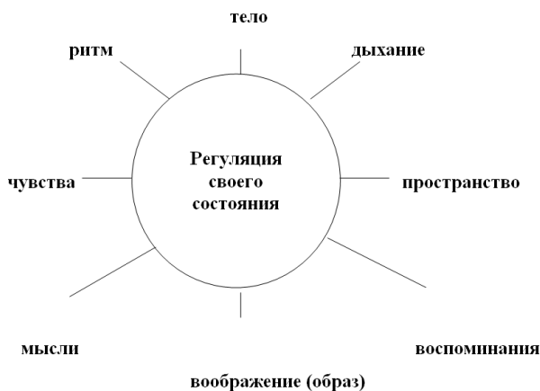
Что используется в техниках саморегуляции (по Слободчикову)